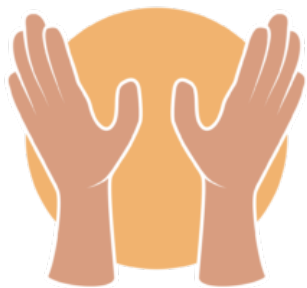
La main à la pâte

« Toute ma vie, je te dirai merci et je lèverai les mains pour rendre gloire à ton nom » Psaume 63, 5