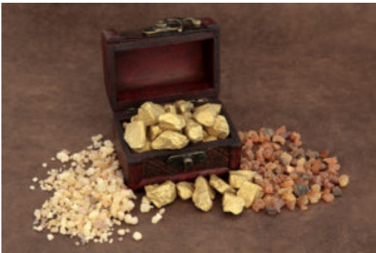
Gold frankincense and myrrh and an old wooden box over brown lokta paper.