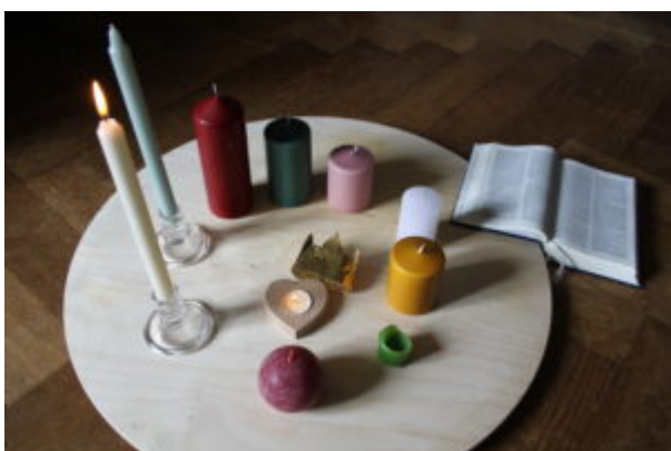
Les photos de l'animation créatrice