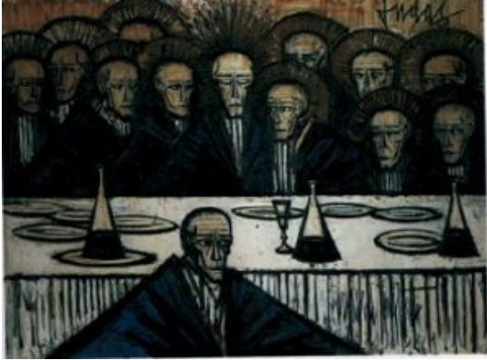
La Cène, de Bernard Buffet