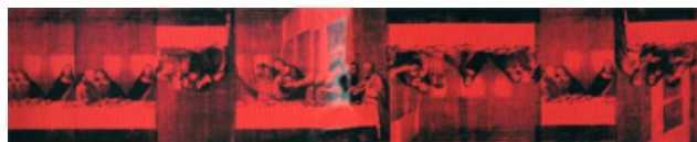
Last supper, 1986, par Andy Warhol (1928-1987). 2 m x 10,1 m, Collection particulière