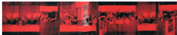
Last supper, 1986, par Andy Warhol (1928-1987). 2 m x 10,1 m, Collection particulière