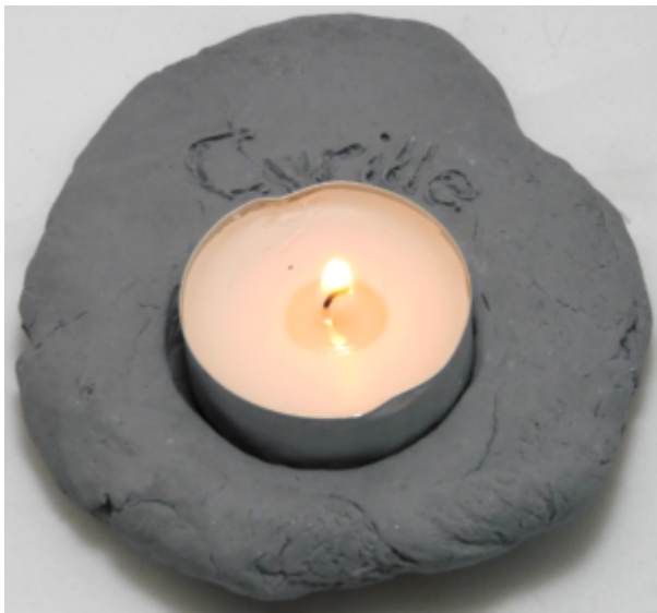
Les photos de la narration biblique