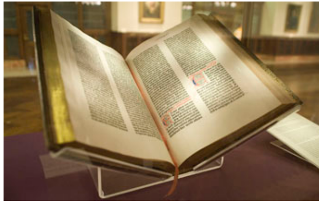
Bible de Gutenberg

C'est l'humanisme qui va utiliser le livre pour lancer ses idées nouvelles en marge des Églises et des universités. La Réforme n'est pas loin.