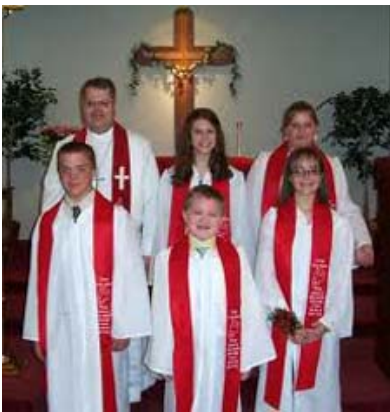
Confirmation luthérienne avec aube et étole

En France, étudions, les liturgies luthériennes de 1844 : comme les précédentes, on peut affirmer qu'il y a un double mouvement, celui qui marque l'initiative de la grâce et celui qui correspond à l'engagement du confirmand.