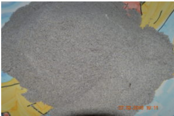
La pâte à sel au café colorée