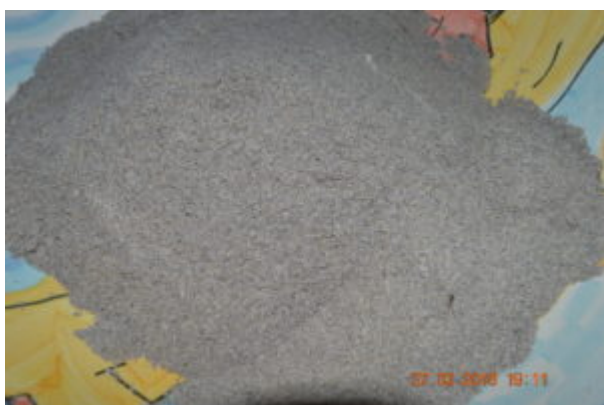
La pâte à sel au café colorée