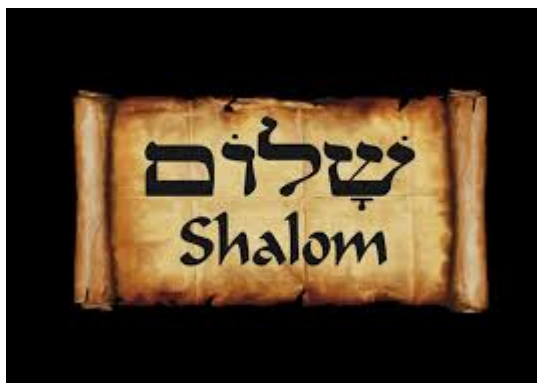
Image à coller : shalom en français et en hébreu, parce que c'est la langue d'Abraham