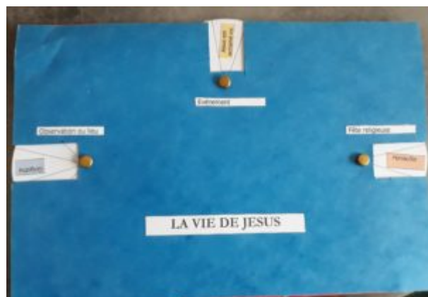
Photo de réalisation sans décors - merci à François Pujol pour son partage

Crédits : Joachim Helmlinger et Etienne Tholozan - photos François Pujol - Point KT