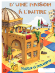
D'une maison à l'autre. Dépliant enfants & familleS