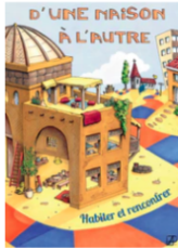
D'une maison à l'autre. Dossier d'animation

Le programme est composé de deux documents à commander actuellement auprès de OPEC-Editions . Ils seront prochainement disponible sur Olivetan :