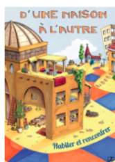
D'une maison à l'autre. Dossier d'animation

Le programme est composé de deux documents à commander actuellement auprès de OPEC-Editions . Ils seront prochainement disponibles sur Olivetan :