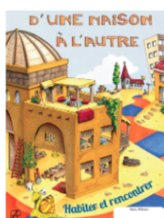
D'une maison à l'autre. Dépliant enfants & familleS