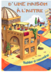
D'une maison à l'autre. Dossier d'animation

Le programme est composé de deux documents à commander actuellement auprès de OPEC-Editions . Ils seront prochainement disponibles sur Olivetan :