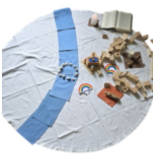
Les photographies de l'Animation créatrice