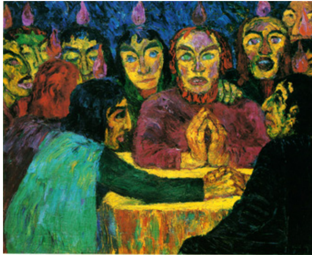
Emil NOLDE, La Pentecôte, 1909, 87 X 107, Berlin, Galerie nationale