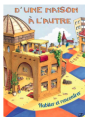
D'une maison à l'autre. Dossier d'animation

Le programme est composé de deux documents à commander actuellement auprès de OPEC-Editions . Ils seront prochainement disponibles sur Olivetan :