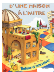
D'une maison à l'autre. Dépliant enfants & familleS