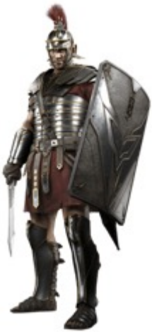
Soldat romain au 1 er siècle ap. J-C

« Tenez bon ! Portez autour de votre taille la vérité en guise de ceinture ; enfilez l'armure de la justice »