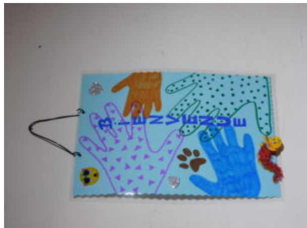
Les photos de l'animation réflexive