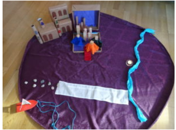
Les photos de l'animation créatrice