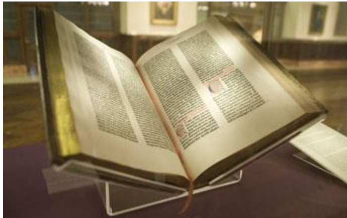
Bible de Gutenberg

C'est l'humanisme qui va utiliser le livre pour lancer ses idées nouvelles en marge des Églises et des universités. La Réforme n'est pas loin.