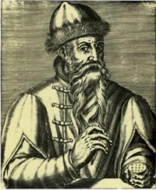
Portrait de Johannes Gutenberg

Lieu de mémoire, de savoir, de transmission, forme artistique, picturale ou poétique, l'écrit reste un mystère, quelque chose de sacré.