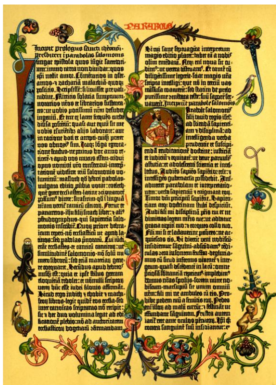
Commentaire de Salomon. Bible de Gutenberg

Pour ces humanistes, le christianisme épuré et revenu à ses origines est un mouvement de l'être. S'ils ont pour certains déjà en tête les grandes options de la Réforme protestante, ils ne désirent pas de rupture avec l'Église établie (cf. l'Éloge de la Folie d'Érasme, ou Gargantua de Rabelais). Cette vision bibliste, malgré les critiques très fortes contre l'Église, s'appuie sur la découverte des valeurs antiques, comme le montre le succès de La vie des hommes illustres de Plutarque, traduit par Amyot, et publié tout au long du XVI e siècle.