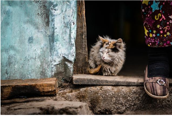
Côté « Lazare » demande d'aide et de solidarité