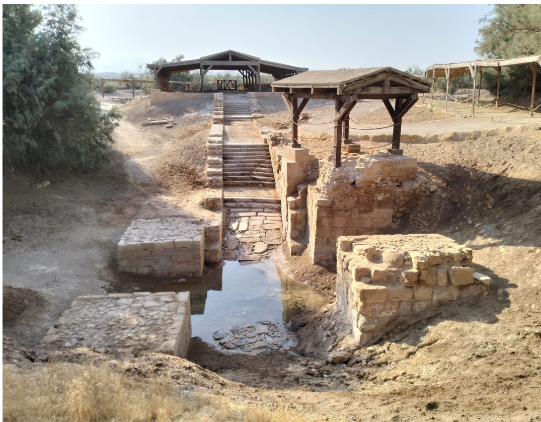
Lieu du baptême de Jésus Christ - Jordanie